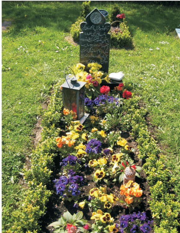
Beispiel eines Grabes auf dem muslimischen Grabfeld

Bis 2007 standen für die Bestattung muslimischer Mitbürger Teilflächen der Grabfelder A 15 und A 16 auf dem Waldfriedhof Aschaffenburg zur Verfügung. Nachdem diese größtenteils belegt waren, wurde ein eigenes muslimisches Grabfeld im hinteren Bereich des Friedhofes eingerichtet. Dieses befindet sich abseits der Grabfelder für christlich Gläubige.