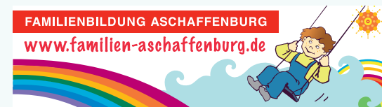
Illustration und Gestaltung: Elvira Roupp Klimaneutral gedruckt; 2024