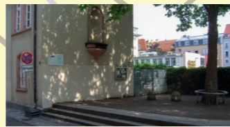
4. Wolfsthalplatz: Am AWO-Gebäude