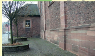
2. Hinter der Sandkirche (ab Frühjahr 2019)