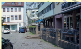
1. Freihofsplatz, entlang der Stützmauer