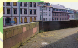
5. Hinter Jesuitenkirche / Christian-Schad-Museum