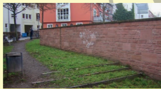
3. Storchennest, Grünstreifen an der Mauer