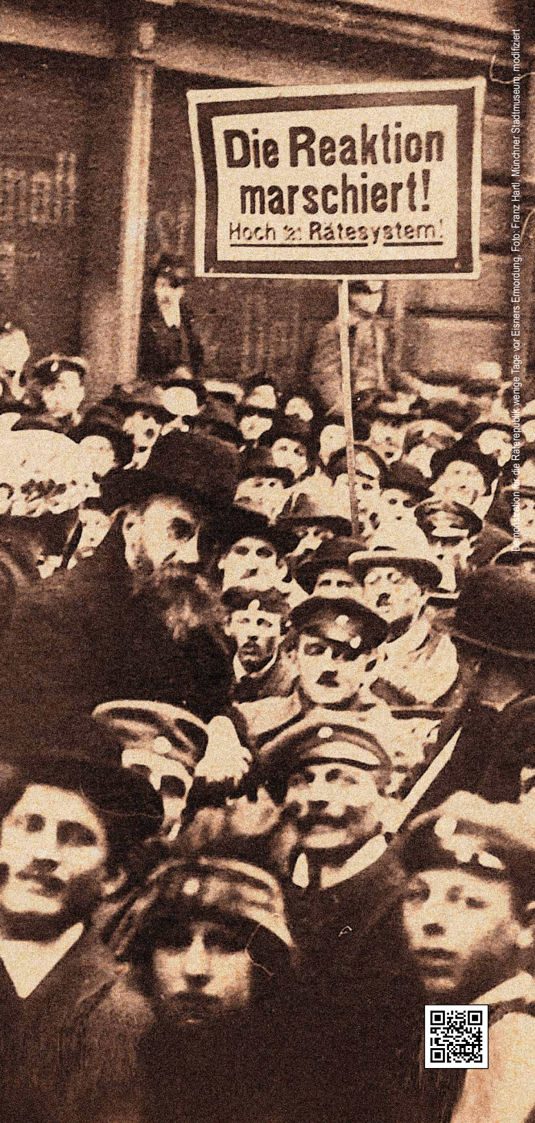
Die Reaktion vor die Räterepublik wenige Tage vor Eisners Ermordung.