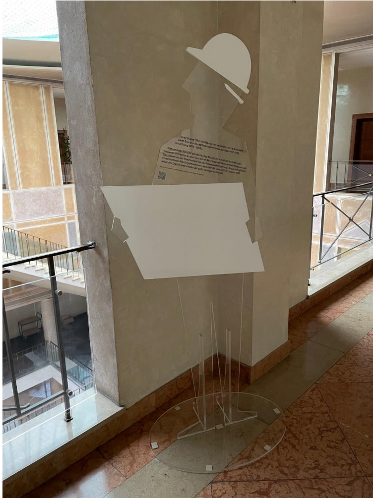
Diez Brandi