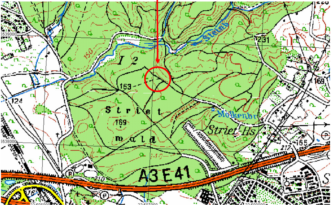
Aschaffenburg, Stadtteil Strietwald, „Pfaffengrund - Grabenschlag“